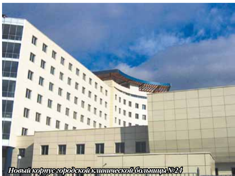
Новый корпус городской клинической больницы №24

Данные вопросы были озвучены на проходившей в ноябре 2011 года встрече с первым заместителем мэра Москвы Владимиром Ресиньим, по итогам которой строительство ливневой канализации включено в столичную адресную инвестиционную программу, также в настоящее время прорабатывается вопрос о строительстве жилого дома для отселения жителей нуждающихся в сносе домов в Тимирязевском районе по адресу: Астрадамская, д. 7. По вопросу строительства детской поликлиники управой направлен запрос в Москомархитектуру с просьбой проинформировать о возможности размещения нового здания учреждения здравоохранения по адресам: Петровско-Разумовский проезд, вл. 24, корп. 17 и 2-я Хуторская ул., д. 6/14, корп. 2. Вопрос возведения поликлиники на данных участках будет рассмотрен после расторжения договора аренды земли с ООО «Плотекс» и отселения планируемого к сносу дома серии К-7 (2-я Хуторская ул., д. 6/14, корп. 2).