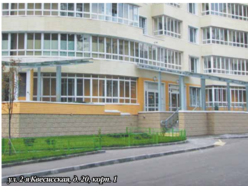
ул. 2-я Квесисская, д. 20, корп. 1