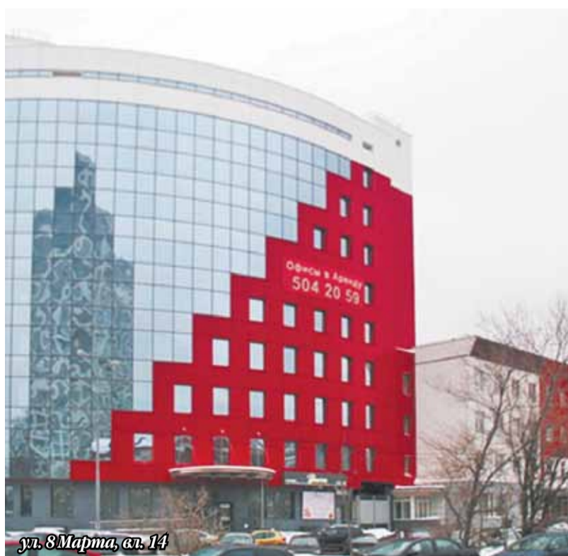
ул. 8 Марта, вл. 14