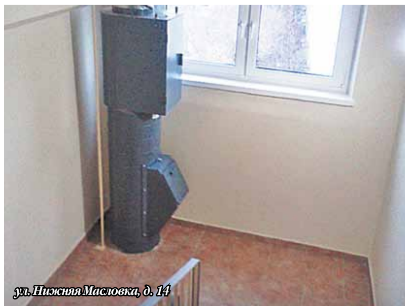
ул. Нижняя Масловка, д. 14