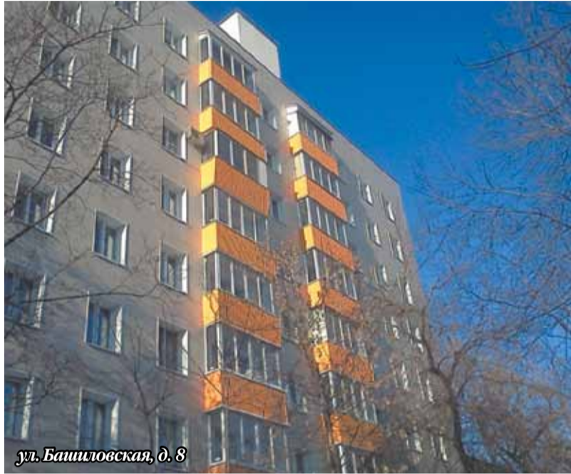
ул. Башиловская, д. 8

У дома 16 в Петровско-Разумовском проезде, в том же проезде, владение 22 и на Нижней Масловке, 18 обустроены межквартальные игровые городки, которые стали любимым местом игр детей района. Капитально отремонтировано восемь домов (ул. Юннатов, д. 8а и д. 17; ул. Нижняя Масловка, д. 14;