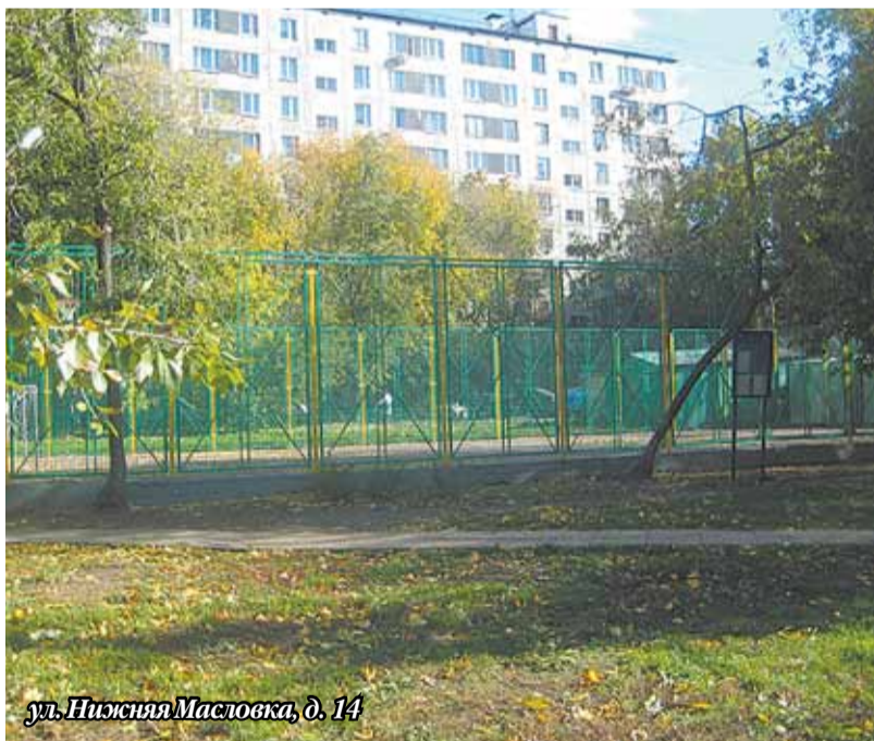
ул. Нижняя Масловка, д. 14