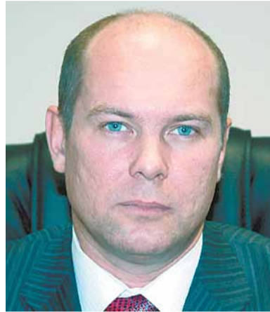
Правящей партией остается «Единая Россия», — отметил глава Высшего совета единороссов Борис

Как сообщают средства массовой информации, Президент России Дмитрий Медведев уже провел телефонные разговоры с лидерами КПРФ, ЛДПР и «Справедливой России». Он поздравил их с прохождением в Думу, а также выразил надежду на конструктивную работу четырех партий в парламенте на благо граждан страны.